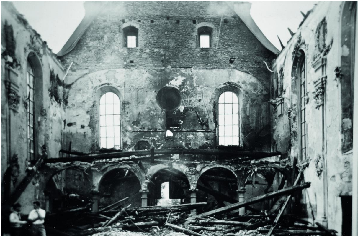
Abbildung: Brand der Klosterkirche St. Ulrich in Kreuzlingen, 1963, Archiv_Amt für Denkmalpflege.

Eine interkantonale Fachgruppe der eidgenössischen Kommission für Kulturgüterschutz wurde vom Bund damit beauftragt, eine Vorlage für eine individuell anpassbare Notfallplanung zusammenzustellen.